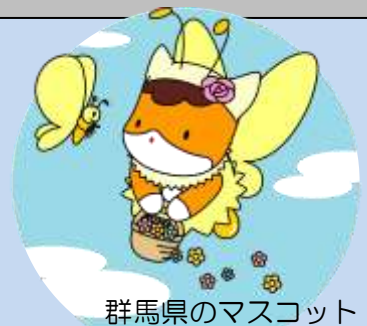
群馬県のマスコット 「ぐんまちゃん」